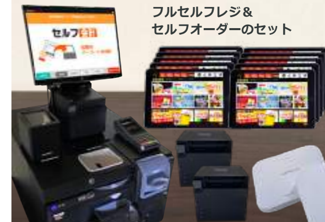
フルセルフレジ&セルフオーダーのセット