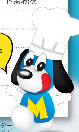
イメージキャラクター まいどっくん