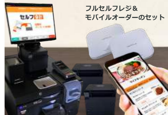
フルセルフレジ&モバイルオーダーのセット

回線費用・LAN配線・コンセント工事は含まれません。また、店舗環境により機器追加が必要な場合がございます。